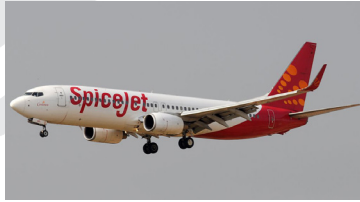
سبايس جت للطيران