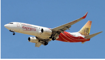
طيران الهند اكسبريس