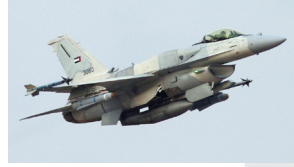
طائرات سلاح الجو الإتحادي